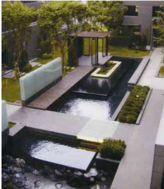
圖 7 2004 園冶獎〈自由自在〉

早期只關注有無綠地，進而重視景觀設計、原生樹種養護等，更提出降低微氣候的親水空間設計、永續生態議題、生活情境佈局、夜間燈光展演，情趣的鋪陳安排，進而關懷高齡者與婦幼階層、人文、藝術、健康、養生休閒、社區營造與守護家園等，把中庭當成是居家生活交流中心，在都市景觀作品，更融入居民實用性與在地文化特質，把外部空間當成生活的大客廳在經營，城市經營者與企業經理家，慢慢熟悉應加註更多情感與專業，關心居民要什麼，在乎什麼，以民眾需求為依歸，更謙卑的，以減量方式來思考大自然的平衡。但是未來需注意如何創新思維，打造一片建築產業藍海，更要注意的，應以客戶為中心，而不是以產品為中心，服務多元化，提高附帶價值，整合多元服務。