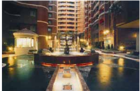
圖 3 1998 園冶獎〈國揚大學〉