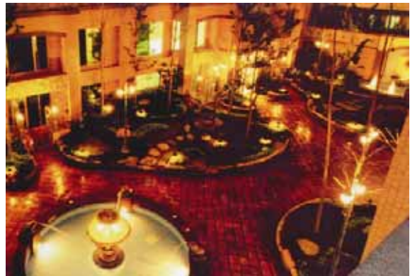
圖 4 1999 園冶獎〈太子殿廈〉