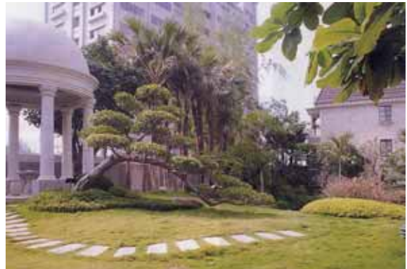
圖 5 2000 園冶獎〈圓山仰德〉