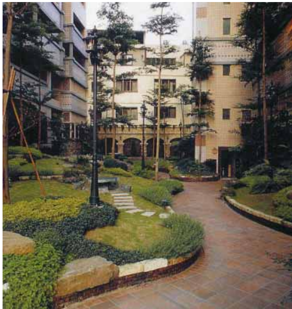
圖 2 1997 園冶獎〈太子哈佛〉