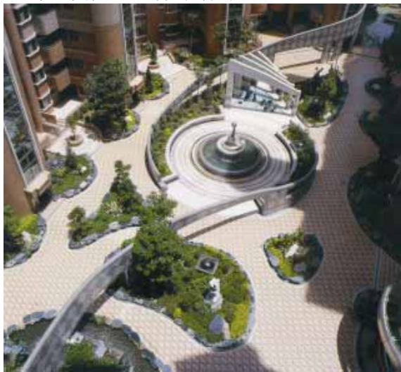
圖 1 1995 園冶獎〈北國麗景〉